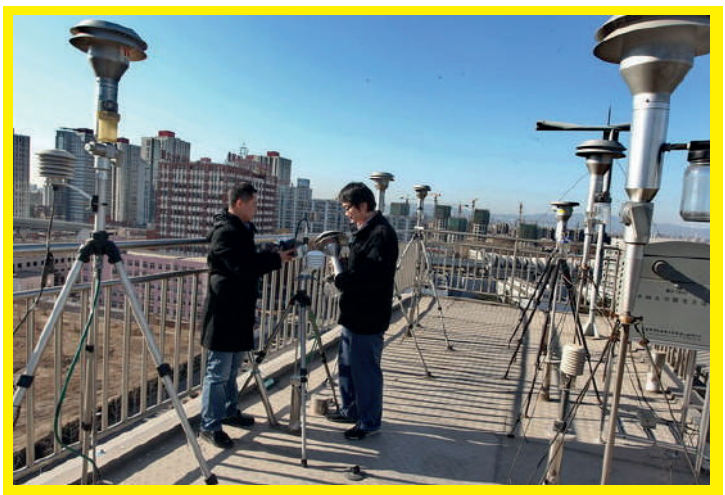
China National Environment Monitor Centre workers inspect PM2.5 monitoring equipment in Beijing, January 2012.

ཕྱི་ལོ་ ༢༠༡༢ ལྷ་དང་པོའི་ནང་དུ་སྲིད་གཞུང་གིས་མི་ཅིང་དང་། གོང་ཁྱེར་ཆེ་ཁག་གཞན་གི་ནང་དུ་མི་ཨམ་ ༡༥ བརྗེད་དེ་རྒྱུད་གི་སྲུས་ ཚད་གཞལ་རྒྱ་འགོ་བཙུགས་པ་དང་། རྒྱལ་ཡོངས་སུ་ ༢༠༡༢ རང་ཚུད་ལག་བསྟར་བྱེད་རྒྱ་བྱས། མང་ཚོགས་གི་གཞི་རྒྱ་སྲུང་སྐྱོབ་ལ་ ལན་འདི་ལྟར་བྱུང་བ་དེས། དུ་ལམ་བརྗེད་པའི་མང་ཚོགས་སྐྱེལ་སྐོར་གི་སྐྱོབ་སྲུང་ལ་ལུས་སྲུང་སྐྱོབ་ཆེ་བ་གསལ་བསྟགས་བྱས་པ་རེད།